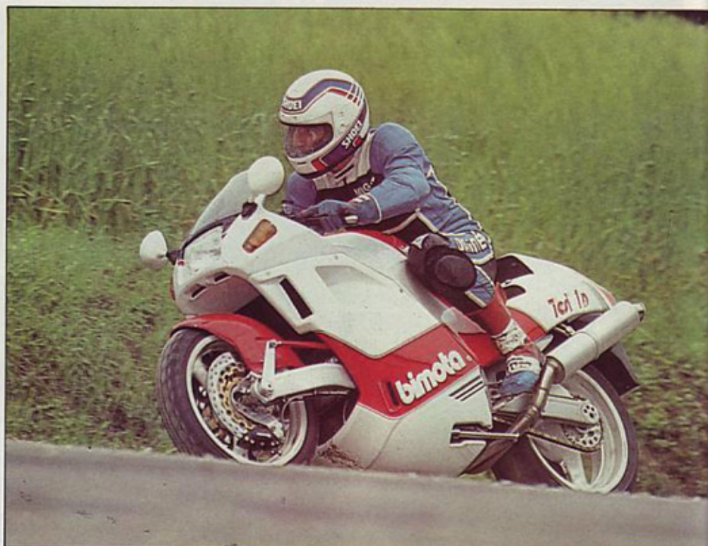
Made in Italy: ekskluzivne rešitve v konstrukciji, Ducatijev motor, kolesa Marchesini, zavore Brembo, blažilnika Marzocchi ter vsične linije

Bimotin motocikel korenito posega v tradicionalne sheme motocikla in prinaša povsem definirano alternativo teleskopski vilici, elementu, ki se je v stotih letih motociklizma še najmanj spreminjal. Šibke točke klasično zasnovanega motocikla, to je posedanja prednjega dela pri zaviranju in s tem povezanega