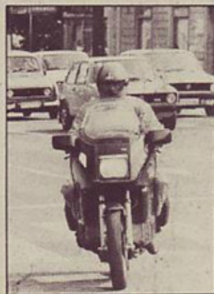
Zajeten aerodinamični oklep učinkovito ščiti voznika pred vetrom, dežjem in mrazom

V kratkih rokavih sem odjugal tistih 500 kilometrov poti do doma: aerodinamični oklep je zares oblikovan tako, da je vozniku v pomoč: ob odprtem