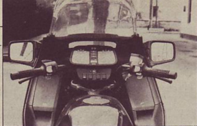
Voznikov prostor: višje krmilo, v oklep vgrajena vzratna ogledala, v oklepu dva predala za drobno prtljago