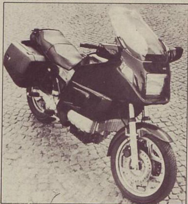
Motocikel je nastal iz osnovne verzije z dodatkom oklepa, kovčkov in bogatejšee opreme

Tudi serija K 100 je bila deležna klasične recepture: iz osnov-