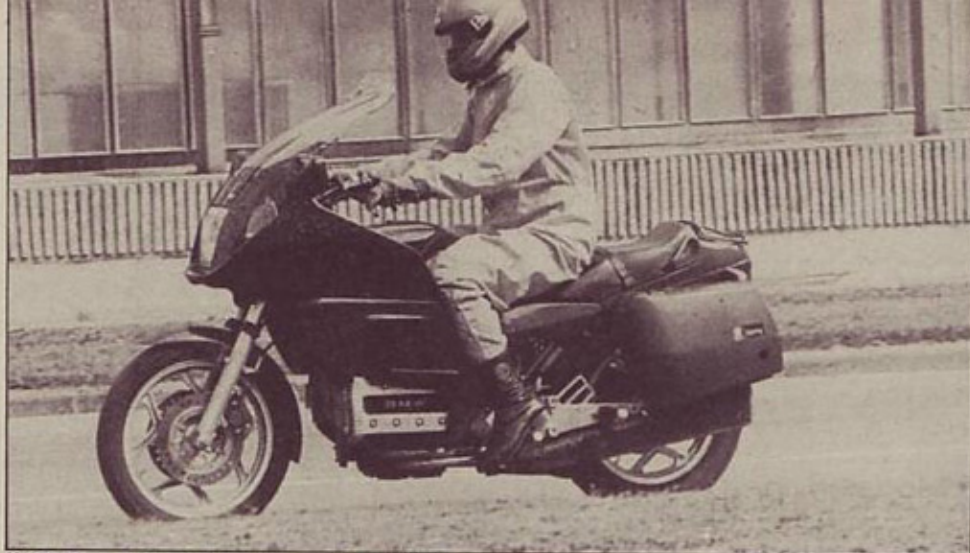
K 100 RT – idealen za dolga in hitra potovanja

Mar ni zanimivo, kako se voznike želje z leti spreminjajo in kako rastejo zahteve?