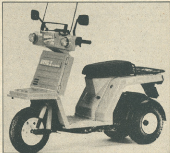
Gyro X – trikolesni skuter, ki je odličen v brezpotju

Najživahnjša na področju skuterjev sta Honda in Yamaha. Honda je predstavila svoj trikolesni skuter giro X, ki ga poganja dvo-taktni 50 kubičen motor in se odli-