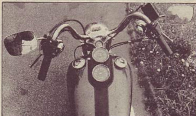
Vozniku na obeh: nevsakdanje vgrajeni instrumenti. Visoko krmilo je opremljeno s prijetnimi ročicami in lahko obvladljivimi stikali

pomeni opazen prihranek pri teži, ki je konstantno šibka točka motociklov Harley – low rider tehta dobrih 270 kilogramov.