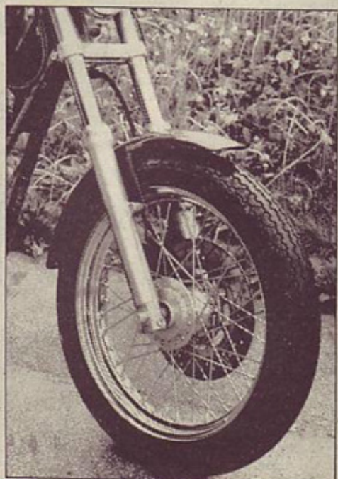
Klasični kolesi sta obuta v Dunlop gume. Prednje in zadnje kolo zavira po en kolut Ø 292 mm