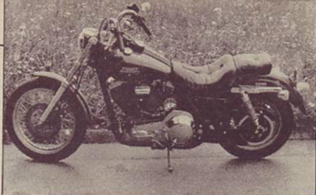
Harley davidson low rider – veliko podobnosti z modelom 883 sportster, na oko popolnejši

Malega harleya 883, o katerem zapis smo objavili v 11. številki, sem še premeval v mislih, ko je zazvonil telefon.