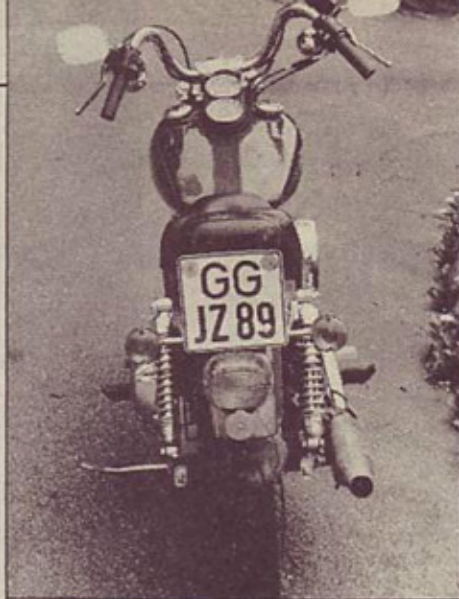
Pogled izdaja, da je low rider zajeten kos motocikla, robustno zasnovan