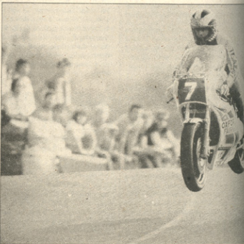
Man je atraktiven (na sliki Phil Read, letos ponovno na dirkalnem motokicku)

sta ni skupej 100 metrov ravna, vsaj malo zavija in TT nevajen dirkač vse preveč zavija in premočno nagiba. Steza se vije od najnižje točke pa vse do gora v najvišji točki otoka. Letos smo na srečo imeli zelo lepo vreme vseh 14 dni. Na otoku se česa takega že deset