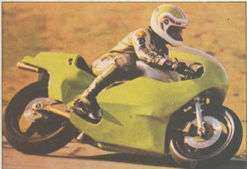
Ballington se je z modelom 82 pojavil v precej neugodnih vremenskih razmerah, a dosegel kar ugodne čase

Kawasaki je svoj GP dirkalnik preizkušal v Italiji – Nov okvir ter želje po naslovu prvaka