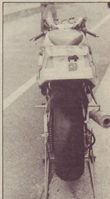
Osnovna predelava motocikla je bila v menjavi serijskih gum z dirkalnimi

predrag. Kajti vsak nov konj v motorju in vsak kilogram teže manj spremeni dirkanje v globoko brezno, ki pogoltne nesorazmerno veliko denarja. Za poceni in kljub temu rezultate obetavno dirkanje pa je motocikel, tak kot je, dober. In ko mu vrneš luči ter gume s primernim profilom, se z njim lahko odpelješ tudi na izlet. V redu, mar ne?