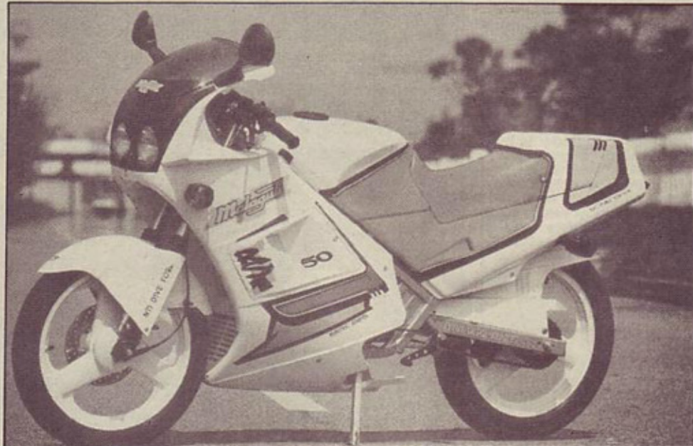
Malaguti RST 50 – po zmogljivostih moped, po izgledu vsaj 125 kubični motocikel

Kljub všečnemu izgledu pa je moped bogat tudi »pod kožo«.