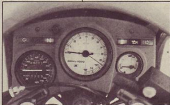
Armaturna plošča: v centru merilnik vrtljajev, levo merilnik hitrosti, desno termometer hladilne tekočine, z obeh strani serija signalnih lučk