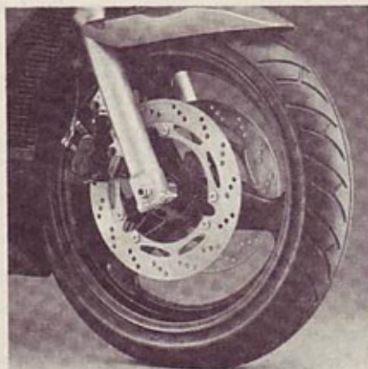
Prednji del: klasične teleskopske vilice, trikrako aluminijasto kolo, par 290-mm zavornih kolutov

RF 600 R poganja na novo skonstruirani motor, vrstni štirivaljnik z vodnim hlajenjem,