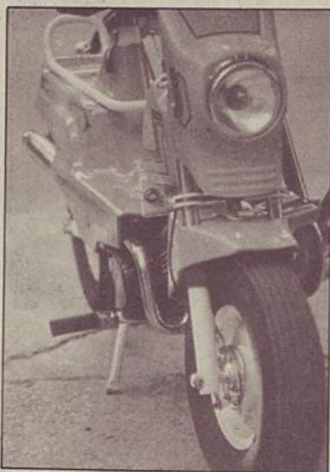
Višja kvaliteta se zrcali v popolnejši obdelavi in sijajnih barvah

Moped letnika 86 je na prvi pogled popolna novost. Kajti designerski popravki, ki se odražajo v popolnoma novem videzu mopeda, so vozilcu vdahnili več mladosti. Povsem nove oblike prinaša maska na prednjem žarometu, rezervoar, prednji blatnik, školjka, ki