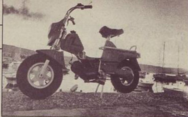
Ostaja kvaliteten motor kopskega Tomosa, z dvostopenjskim avtomatskim menjalnikom

Moped je po prvem letu prodaje doživel številne in opazne lepote popravke