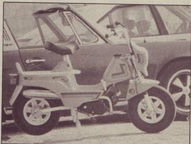
TORI letnik 86: nove oblike, nova kolesa in gume, kopica drobnih popravkov