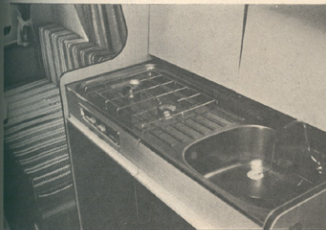
Lanski del prikolice: kuhalnik, pomivalnik in tekoča voda.

Zavarovanje: Obvezno — velja polica vseh letnega vozila; Kasko — Sava