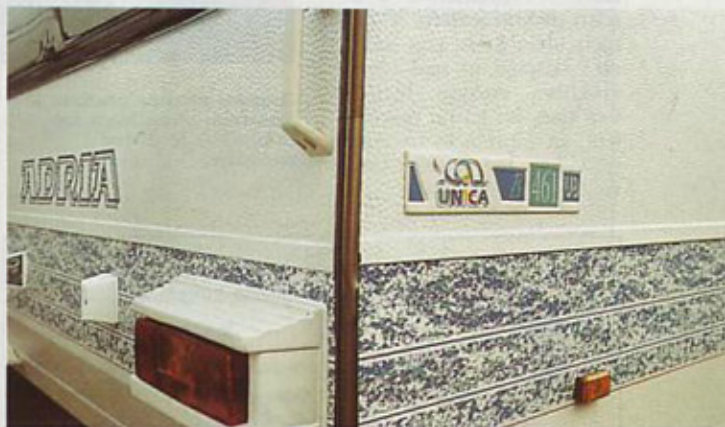
Značilen vzorec na okrasnem pasu okrog bokov in skrbno izdelani detajli poskrbijo za prijeten videz.

Za naš preskus smo na peugeot 806 turbo SV pripeli počitniško prikolico unico B 461 UB, s skupno dovoljeno težo 1100 kg. Peugeotov enoprostornik je kot nalašč za vleko novomeških prikolic. Kar 10 njihovih modelov ne preseže skupne teže 1300 kg,