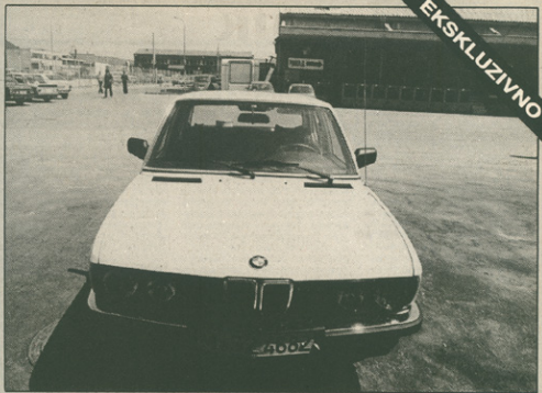
Prvi dizelski BMW: 524 TD