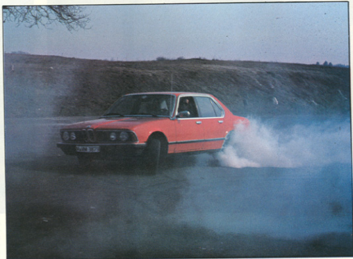
BMW 728 i

Petje so v tovarni, sredi lanskega leta, serijo »7« malce pomladili, predvsem z prvirnejšo opremo in z močnejšimi motorji, na račun vbrizgovalnih naprav. Tako so dosegli boljše izgorevanje, obenem s tem pa večje moči, čistejši izpuh in v celotno boljše vozne lastnosti. Obenem so dokazali, da je moč tudi od velikih gibnih prostorih porabili razmeroma malo goriva; in zatrdili, da živahni pospeški in velike končne hitrosti niso zapravljanje denarja: saj je tudi od hitrostnih omejitev pomembno, če vas avtomobil izvleče iz prehitvalne zagate.