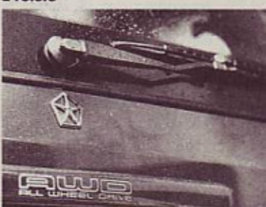
"All wheel drive": vsekolesni pogon, rezervno kolo ne šteje!