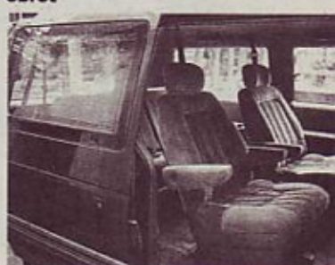
Drсна vrata: vhod v "salon"