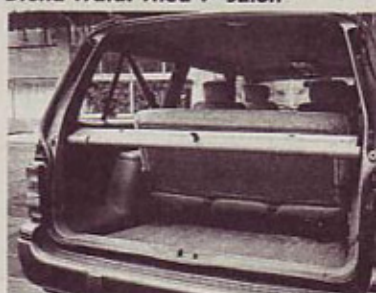
Prtljajnik: 395 osnovnih litrov z rolet