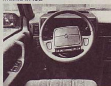
Limuzinski kombi: oblažnjeno udobje in položen volanski obroč