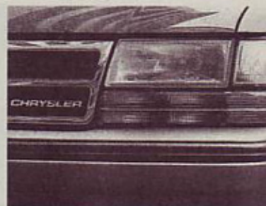
Poševna skladnost: črke, maska in luči

Tekst: MARTIN ČESENJ