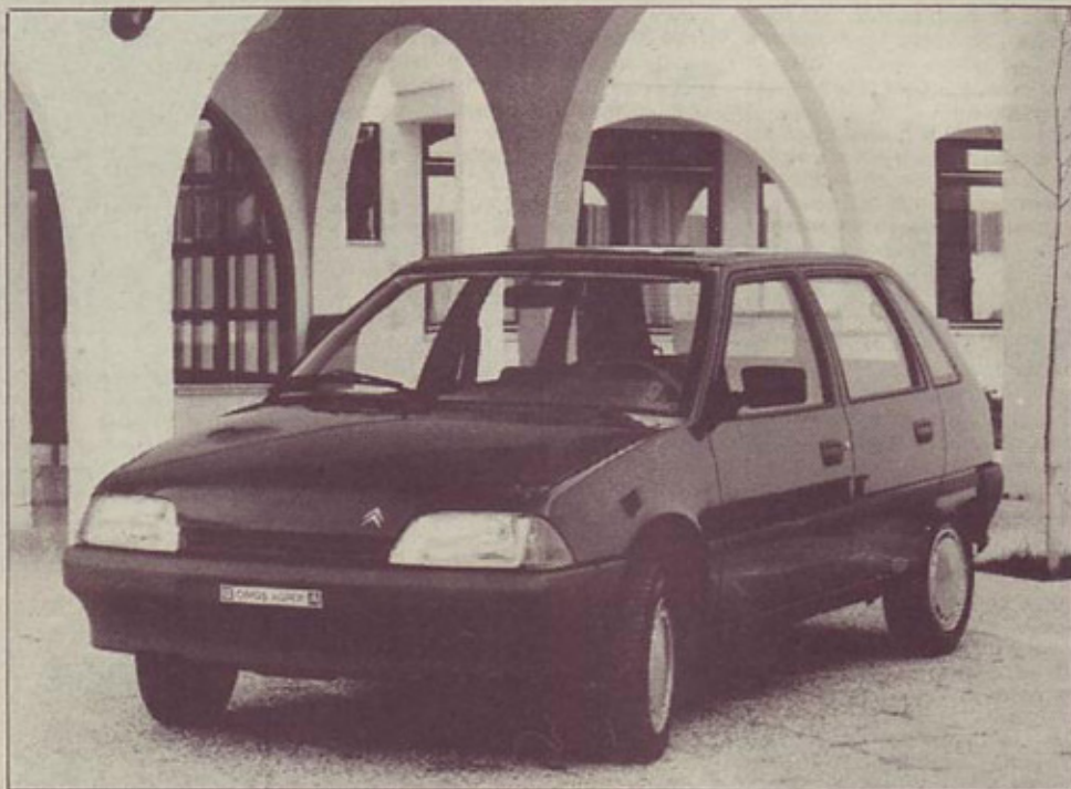
Citroem AX 14 RD

Bencinska motorna ponudba obsega štirivaljnike od 1,0 do 1,4 litra gibne prostornine, prav tolikšno, oziroma natančneje 1360-kubično (vrtina in gib: 75 x 77 mm) gibno prostornino pa ima tudi novi štirivaljni dizel. Seveda je tudi ta motor primerek moderne tehnike: z lahkima blokom in glavo, z zobatim jernom za odmično gred v glavi, z rotacijsko visokotlačno črpalko ter s posrednim vbrzgvanjem goriva v valje. Najobremenjeneše motorne dele so oplemenitili s fosforiranjem in siliciranjem, že znani bencinski motor, ki so ga uporabili za izhodiš-