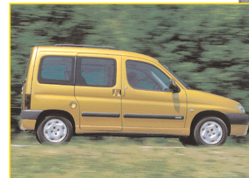
Stranska drsna vrata na obeh straneh so del serijske opreme v paketu Modutop.

Strešna nosilca je mogoče namestiti prečno ali pa ju povsem odstraniti.