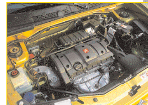
Odlukujeta ga veselje do vrtenja in zmerna poraba goriva.

Zaradi konkurence in čedalje strožjih ekoloških zahtev so citroënovci morali osvežiti motorno paletu s šestnajstventilsko tehniko. Motor je že doživel premiero v Xsarah, sedaj pa so ga namenili tudi Berlingu. Čeprav ima za dva decilitra manjšo prostornino od predhodnika, se ponaša z večjo močjo in manjšo porabo goriva. Do tod vse lepo in prav in vsa čast štirim ventilom nad vsakim valjem in dvema odmičnima gredema, ki vse skupaj krmilita. Zadeva je spodletela pri krivulji navora, ki svoj vrh doseže šele pri 4000 vrtljajih v minuti. Če bi šlo za športno Xsaro Coupé, to ne bi bilo tako hudo. Motor je pač treba priganjati v višje vrtljaje, da pokaže, kaj zmore. Voziti v nižjih vrtljajih je za športnike tako ali tako greh. Pri Berlingu pa gredo stvari malo drugače, saj je avtomobil namenjen drugačnemu slogu. Slogu, ki ne pozna naglice in dokazovanja in ki da veliko na ugled in eleganco. In pri tem novi motor ni najboljši partner.