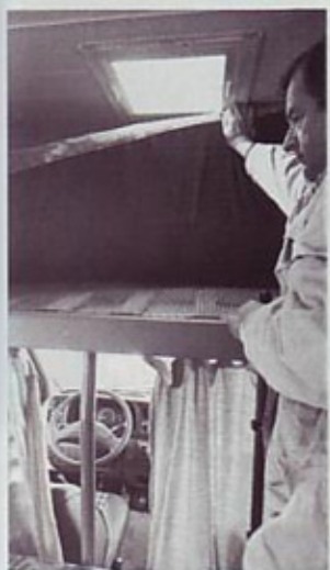
Pod vzmetnico dvojnega ležišča v mansardi so lesene letve in posebna mreža, pod katero kroži pozimi ogreti zrak.

Dethleffsovi bivalniki ločijo od drugih, narejenih bolj ali manj po enem kopitu. Tako ima kontrolne instrumente za napetost akumulatorjev in količino vode v posodah na armaturni plošči, posoda za svežo vodo je pod prednjima sedežema in tudi odprtina za nalivanje vode je v kabini.