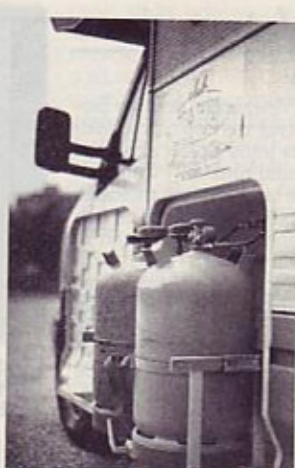
Plinski jeklenki na drsečem dnu z lahkoto izvlčete in zamenjate.