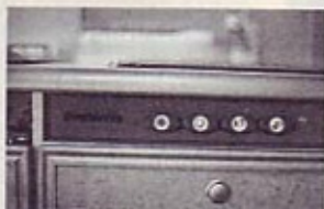
Ročaji pip za plinsko napeljavno so na priročnem mestu, na prednji steni kuhinjskega bloka skupaj z gumbi kuharstva in hladilnika.

večji varnosti in delno tudi večji prodaji, imajo novi modeli še nekaj novosti, ki jih postavljajo pred tekmece in s katerimi upajo, da bodo spodbudili kupce in zavrli splošno upadanja povpraševanja po bivalnikih.