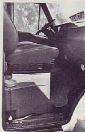
Posoda za svežo vodo je zasnovana kot vezna posoda, spravljena pod obema sedežema.