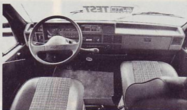
Plošča z merilniki za količino vode v posodah, za napetost v akumulatorjih in z varovalkami je v armaturni plošči nad radijskim sprejemnikom v kokpitu.

Posebnost bivalnikov iz tovarne Dethleffs je tudi prtljažnik pod zadnjim delom. S posebnim vretenom ga spustite navdol in potem potegnete ven. V širino meri 2,25 metra, v globino slab meter in v višino blizu 20 cm. Prav priročno za smuči, senčnik ali zložljive ležalnike.