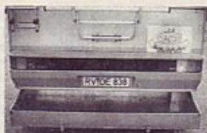
Prostora prtljažnik, ki ga izvlčete izpod poda, je kot nalašč za smuči, senčnike ali zložljive ležalnike.