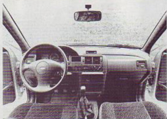
Armatura plošča: temeljita, a nič posebnega