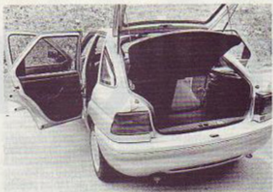
Dovolj velik in še povečljiv prtljažnik