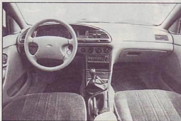
Kokpit - za potovalno udobje

Vrat je pri mondeu travellerju obvezno pet. In pet je tudi sedežev v njem. Od tega, kako spretno znata odštevati potnike, je odvisna notranja velikost zadka. Ta je že v osnovi in ob razprtih zadnji klop dovolj velik: dolg 1138 mm (med notranjima blatnikoma), širok 1144 mm (v celem pomeni to 1,43 m 2 nakladalne površine) in visok 842 mm. To znese za 650 litrov prtljažniške praznine. Zadnje klopi je moč zložiti deloma ali