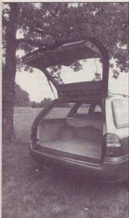
Visoka vrata, velik prtljažnik - za kombijevstvo v najboljšem pomenu besede

izgubiti pravi stik z voziščem. Ampak napaka ni tolikšna, da bi vozilu vzela "ravnatežje".