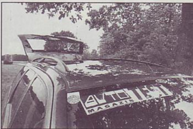
Strešni prtljažnik - za dodatne, tipizirane možnosti

v celem; v slednjem primeru pomeni to 1900 mm talne dolžine, ob že znani širini in višini pa 2,39 m 2 nakladalne površine in za 1650 litrov prtljažne prostornine.