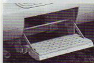
Električno krmiljena vstopna stopnica je pri Hymerju standardna oprema.