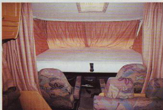
Udobno dvojno ležišče spustite izpod stropa nad voznikov in sovoznikov sedež. Zavesa se ob tem razpre sama.

Tovarna Hymer je še enkrat prehitela vse tekmece: kot prva in za zdaj edina si je s kakovostjo zaslužila certifikat ISO 9001. Hymer bo zagotovo spet nekaj časa nedosegljiv in je še zmeraj usmerjen k premožnejšim kupcem. Italijansko miniranje evropskega trga z nizkimi cenami pa je celo to vodilno tovar-