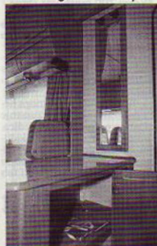
Omarica ob zadnjih vhodnih vratih in ogledalo nad njo.

vozil potrjuje tudi šestletna garancija za tesnjenje.