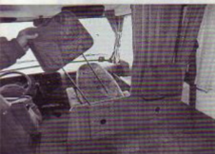
V serijski opremi je varnostni paket z dvema tritočkovnima in z dvema dvotočkovnima varnostnima pasovoma in s štirimi oporniki za glavo. Ti varnostni oporniki so nastavljivi po višini, lahko pa jih tudi odstranite.