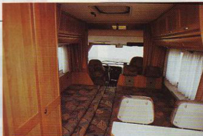
Pravi ležalni poligon sestavite iz vzdolžne klopi in sedežne skupine v sredini bivalnega prostora. V ospredju na levi je omara za obleko, ki ji prav tako kot kuhinjskemu delu in vходу v toaletni prostor razprostrto ležišče ni napoti.