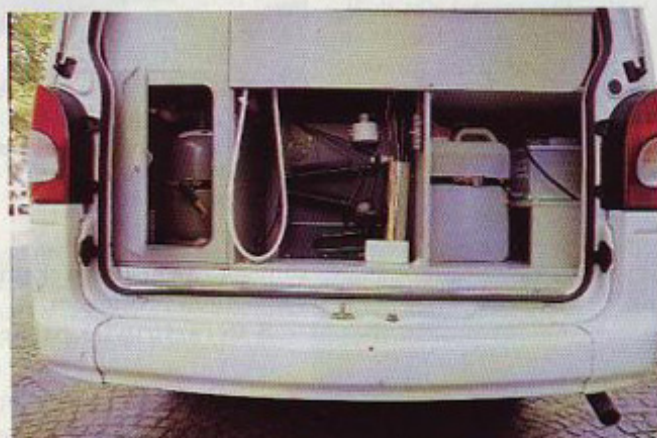
Ko dvignete zadnja vrata, je pred vami zadnja stena kuhinjskega bloka in omarica za jeklenki za plin ter posodi za svežo in umazano vodo. Od tod je dosegljiv tudi dodatni akumulator, ki skrbi za razsvetljava v bivalnem delu.