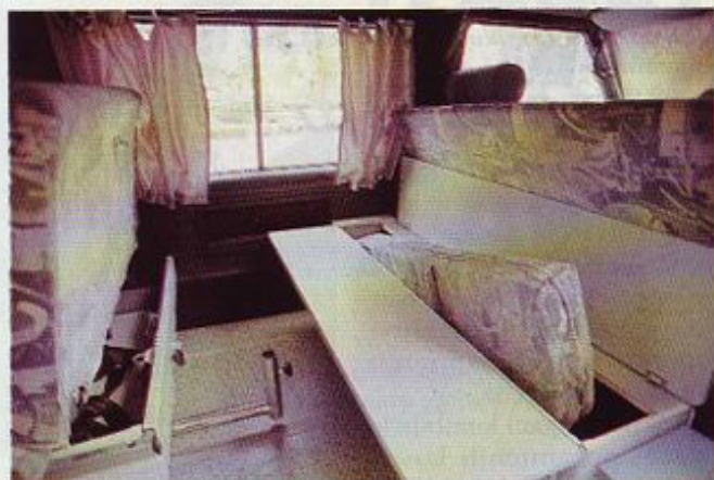
Dodatne blazine za ležišče, zavese za prednja okna in orodje je spravljeno pod prednjo klopio sedežne skupine.