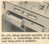
Na plin deluje domače ognjišče, ki je izdelano iz nerjavečega jekla; tam je tudi nekaj police in predalov.