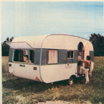
Testna prikolicca je že zelo velika, za dva para ravno pravna. Čez leta, ko otroci zrastejo, pa za eno rodolino.

Vse prikolicce, ki se lahko kupijo pri nas, so prav takšne kakršne IMV izvaža, torej narejene so po zelo natančnih, evropskih standardnih. Vsaj tu smo nekako dohiteli ali celo prehiteli tehnično in gospodarsko razvite zahodno evropske dežele.