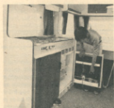
Kuhinjski blok je praktično opremljen, vse je na dosegu roke. Litrske steklenice ne gredo pokonci v hladilnik, zato pa gre več steklenic piva. Za tiste, ki so prijatelji vina, priporočamo 7 decilitrskih steklenice, če želite piti ohlajeno vino.