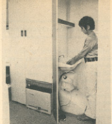
Za svažnike sanitarij v jadranskih kampih je na večjo lastni toaletni prostor; na sliki vidimo še dve omari in plinsko pečico.

Ker v Novem mestu večino svoje proizvodnje izvozijo, morajo začasno uvoziti tudi hladilnike. Tega, da v svetu proizvajajo take hladilnike le tri tovarne, ni treba posebej poudariti. Vendar, zaradi veljavnih predpisov imajo Novomeščani posebno službo, ki skrbi za to, da hladilnike najprej uvozijo in stoor natančno številno, toliko, kolikor jih potem izvozijo v vsako od dvanajstih držav, z katere IMV izvaža. Ne nisem dobro povedal: Hladilnike morajo uvoziti iz vsake od dvanajstih držav posebej, samo zato, da je brokracija zadoščeno.