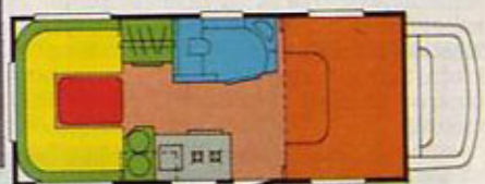
Traveller 520 U

sta še posebej odcejevalnik in kuhalnik s tremi plinskimi gorilniki. Pod njim je 60-litrski hladilnik na plin, 12 V ali 220 V, ki deluje tudi če bivalnik stoji postrani. Omarice, predali in police na doseg rok olajšajo delo gospodinji, ki med pripravljanjem kosila prav nič ne moti družine, ki sedi za mizo v prednjem delu bivalnika. Ta sedežna skupina se lahko zvečer spremeni v ležišče, široko 1000 ali 1280 mm, še za dva pa je prostora v 610 mm visoki mansardi, na postelji, široki 1380 cm. Skrb, da bi se nadebudneža med spanjem