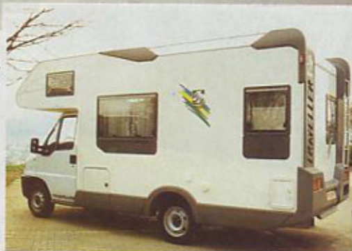
Knaus traveller 595

Ob za knause že značilni zadnji steni, z močnimi sivimi plastičnimi robovi, so zunanje stene iz gladke aluminijaste pločevine. To so do sedaj premogli samo najmenitnejši iz Knausove družine. Mehak,