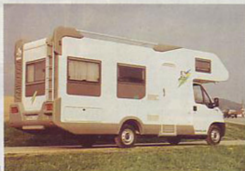
Knaus traveller 685 HF

Že skoraj dirkalnik pa je model 685 s turbodizelskim motorjem, ki po novem premore 116 konjskih moči.