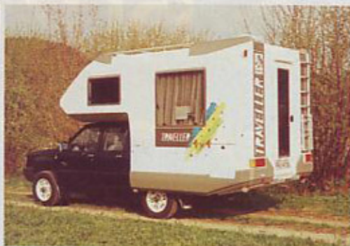
Knaus traveller X