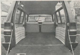
Radodaren prtljažnik in pripravna zadnja vrata (po ameriškem receptu)