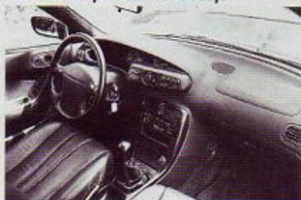
Armaturna plošča: navdušuje