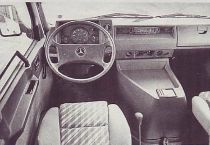
Skopa, pregledna in temeljita armaturna plošča

Dva velika iz Nemčije, Mercedes in Volkswagen, sodelujeta s špansko avtomobilsko industrijo – Volkswagen je kupil Seat, Mercedesov koncern pa izdeluje dostavna vozila MB 100 D, ki nosijo oznako Made in Spain.