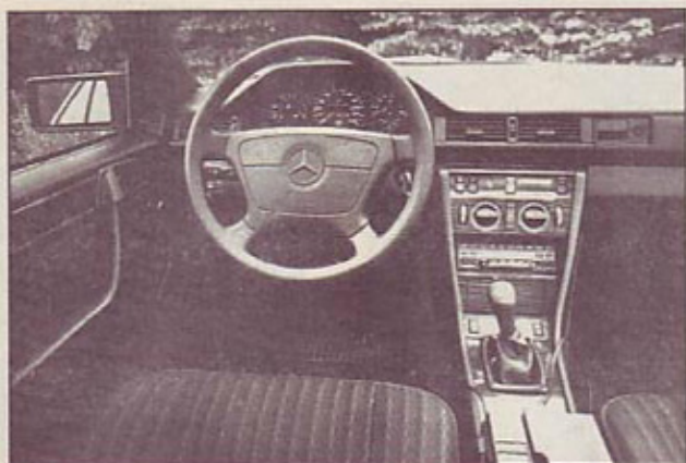
Zrelost okolja in zračna vreča v volanskem obroču