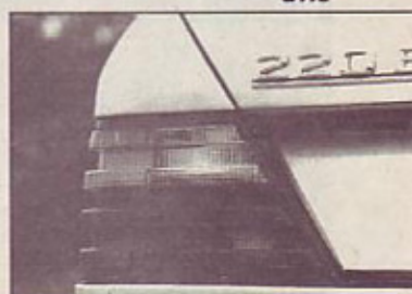
Zrelost vrste: odslej bo pisalo E 220

ko kot pri največjih mercedesih S), plastična maska bo vsajena globlje v oblejši motorni pokrov, zadek bodo rahlo preoblikovali in motorna tehnika bo še izbornejša. Takšni bodo ti mercedesi - 220 E bo postal E 220 - ostali vse do leta 1995 in do nastanka novo ponujene in označene palete W 210.