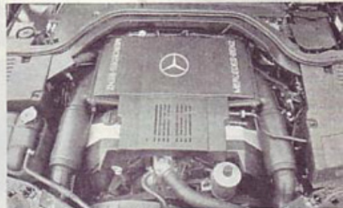
Mercedesov V8 s 326 KM in štirimi ventili na valj.

S tem motorjem pospeši avto z mesta do 100 km na uro v 8,6 sekunde, največja hitrost pa je omejena na 250 km na uro. Pri Mercedesu so dvanajstvaljnik namenili le prestižnemu 600 SEL. 500 SEL pa ima petlitrski V8 s štirimi ventili na valj in