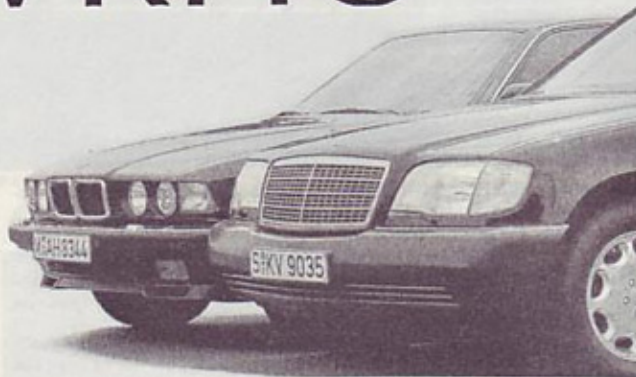
BMW deluje skladnejše od tekmeča, saj je v celem manjši.

BMW 750 iL je daljša verzija tega modela, ki pomeni sam vrh BMW-jeve ponudbe v razredu limuzin. Avto je v celoti dolg 5,02 metra, pri čemer je notranja dolžina 1,85 metra. Njegov tekmeč Mercedes 500 SEL, ki je v Mercedesovi novi paleti drugi na lestvici prestižnih limuzin, pa je nekaj večji, saj meri v dolžino kar 5,21 metra, v notranjosti pa je dolg 1,99 metra. Ima torej nekaj več prostora za potnike, kar mu je vsekakor v prid, saj ima pri tem tudi večji vzdolžni pomik sedežev. BMW ima prtljažni prostor s prostornino okrog 500 litrov, značilno zanj pa je, da je zelo globok in premalo širok, kar omejuje njegovo uporabo. Mercedes pa ima prtljažni prostor s prostornino 525 litrov in je