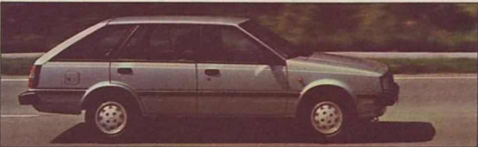
Nissan sunny traveller