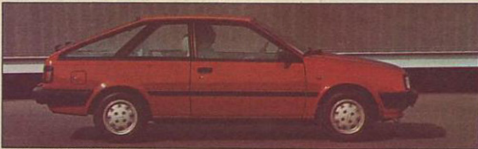
Nissan sunny kombi-kupe