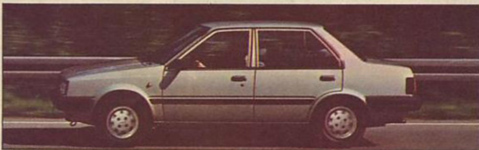
Nissan sunny limuzina

Tokratno jugoslovansko partnerstvo je Nissan sklenil s ljubljansko Avtotehno in ga obeležil s podpisom pogodbe – maja letos, v Ljubljani. Začetek prodaje, pred nekaj tedni, pa so oznanili s kratkima preskusnima vožnjama obeh ponujanih vozil: micre in sunnyja.