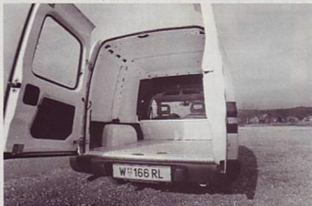
Prtljažnik: kombijevske mere in dobro izkoriščen prostor

Sicer pa se že dolgo ve: osebni avtomobili, "predelani" v lahka dostavna vozila, so danes že več kot le delovno sredstvo, saj poleg tovrstne namembnosti ponujajo že skoraj povsem limuzinsko udobje za tiste, ki jih uporabljajo. In zato imajo pred seboj še lepo prihodnost, novi opel combo pa pri tem ni izjema.