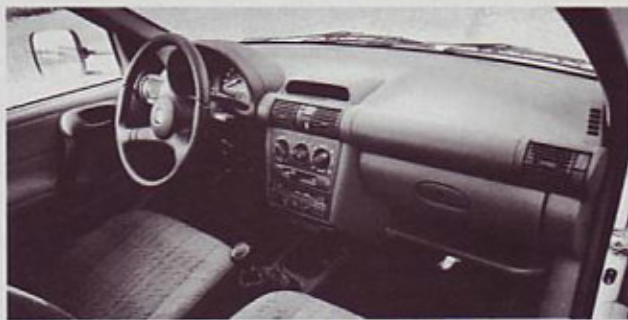
Kokpit: corsa in samo corsa

va precej glasno odzove in potrebuje nekaj časa, da se ogreje do pravišnje delovne temperature, ogret pa steče tiše in se urno odziva na voznikove ukaze. Ob dobrih zmogljivostih kaže pohvaliti tudi zanemarljivo porabo goriva, nezahtevno vzdrževanje in obljubljeni dolgo