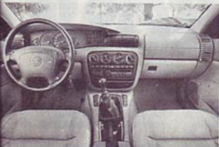
Vzorna armaturna plošča

očitatih, le malo več plemenitega lesa bi ji vseeno lahko namenili.