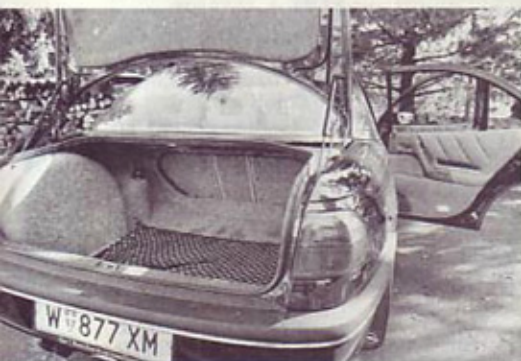
Velik in solidno obdelan prtljažnik

Sliši se nekoliko z ulice ali pravljeno, vendar je omega MV6 trenutno prva med vsemi omegami. To pomeni najmočnejši motor, pa tudi razkošno serijsko opremo. Dovolj razlogov torej za preskus.