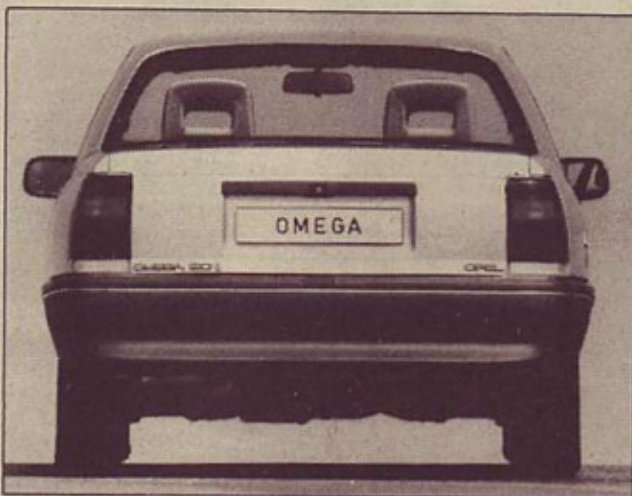
Zadnji del je brez senzacionalnih rešitev