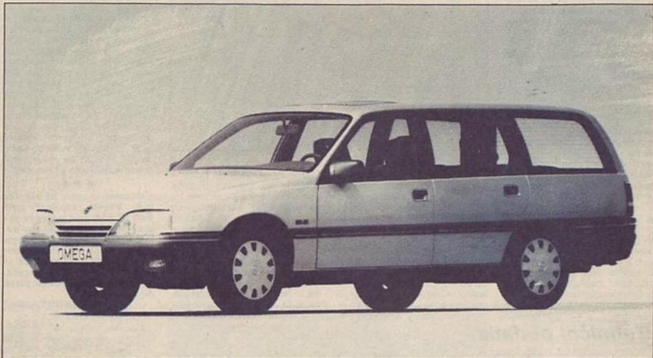
Omega LS v slogu družinske tradicije

V Rüsselsheimu se dogaja nekaj novega. Po petletnih pripravah so se pri Oplu odločili, da pošljejo v svet novo vozilo – omego, ki so jo predstavili na letošnjem pariškem avtomobilskem salonu. Omega bo zamenjala slavn rekord, avtomobil, ki so ga do letošnje prve polovice leta izdelali več kot sedem milijonov. Konstruktorji v Oplu zasnovane rekorda seveda niso kar enostavno zavrgli, kajti tudi nova limuzina je izdelana v klasični maniri: motor spredaj poganja zadnji kolesi.