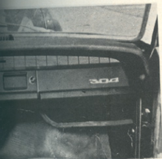
Zadek so breaku 304 prilepili kar od manjšega brata peugeot 204 break