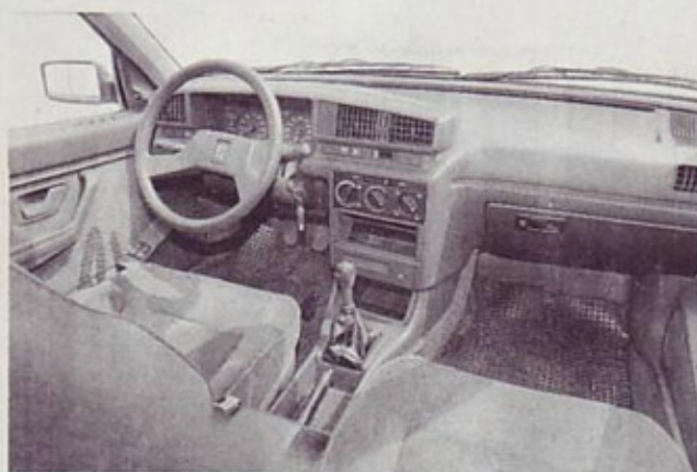
Kokpit: dovolj opremljen, vendar deluje ceneno