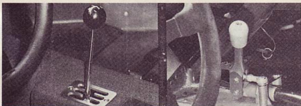
Povsem špartanska opremljenost ferrarija F40.

zgovorno priča o naprednosti ferrarija F40, ki je, čeprav namenjen cestni rabi, težji le za 200 kg.