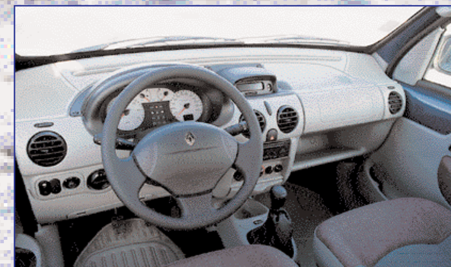
Armatura plošča in materiali v notranjosti so bolj značilni za dostavnike kot osebne avtomobile.

Nekaj je gotovo; Kangoo ni avtomobil, ki bi svojemu lastniku dvigoval ugled. Je pa vozilo, ki mu lahko odlično služi.