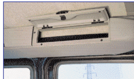
Novost na seznamu doplačil so tudi predali nad glavami zadnjih potnikov.

ob njegovem prihodu želeli tudi štirikolesni pogon. In ga v preteklem letu končno tudi dočakali. Morda ne bo odveč omeniti, da ta ni enak kot v Scénicu RX4. Namesto Puchovega so Kangooju namreč namenili Nissanov štirikolesni pogon, kar pomeni, da za prenos moči k zadnjemu kolesnemu paru skrbi hidravlična sklopka.