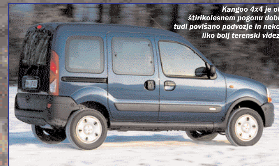
Kangoo 4x4 je ob štirikolesnem pogonu dobil tudi povišano podvozje in nekoliko bolj terenski videz.