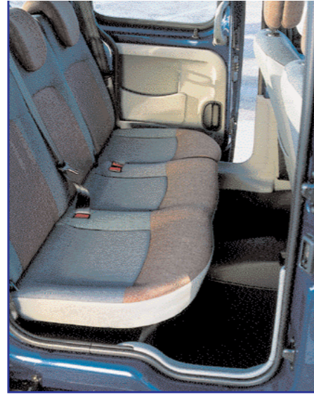
Pozor! Pri izstopanju je potrebna previdnost, saj je prag izredno visok.