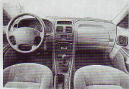
Estetsko zasnovana armaturna plošča

adut lagune udobnost, torej področje, ki je pri Francozih tradicionalno dominantno. Uspelo jim je izdelati zelo harmoničen avto, ki že na prvi pogled naredi na potnike zelo eleganten in kakovosten vtis, in to po zaslugi udobnega, a ne premehega vzmetenja, dobro odmerjenih in (pre)mehkih sedežev, dobre zvočne zatesnenosti kabine, kakovostnega radijskega aparata in še nekaterih malenkosti. Skoraj idealno se prilega zraven še zmogljiv štirivaljnik s po štirimi ventili na valj in močjo 103 kW (140 KM). Deluje povprečno kultivirano, s "polnimi pljuči" zadnja šele nad 4000 vrtljaji in prav visoki