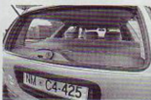
Eden izmed možnih načinov odpiranja zadnjih vrat

Zoper zelo pogosto rosenje bočnih šip v kombijejskem zadku so namestili v šipe gretje, kar učinkovito odpravlja ta problem. So pa zakuhali drugega, in sicer z namestitvijo sredinskega zglavnika na