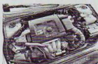
Živahen in ne preveč zahteven motor

Zoper zelo pogosto rosenje bočnih šip v kombijejskem zadku so namestili v šipe gretje, kar učinkovito odpravlja ta problem. So pa zakuhali drugega, in sicer z namestitvijo sredinskega zglavnika na