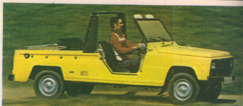
Čim bolj je rodeo oskubljen, tem privlačnejši je na pogled: ogoliti ga je mogoče do konca, do preklapljenе vetrobranske šipe – Tudi delovno mesto voznika je ustrezno špartansko, sicer pa podobno tistemu v renaultu 6

Toda tudi če bi rodeo, ki smo ga sneli streho, ponovno presenetila nevihta, ni nobenega vzroka za paniko. Pod iz umetne snovi ne rjavi. To je ena točka v dobro za tiste voznike, ki vozila uporabljajo v poklicu in pri tem nanosijo vanj blato: Če odstranimo zadnjo, s plastiko