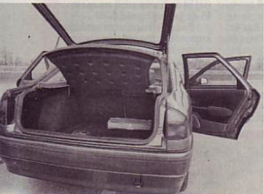
Zajeten in dobro obdelan prtljažnik