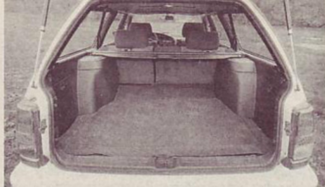
Prtljažnik: pripraven tudi za spalnico

voznika, ko prvič sede vanj. Resda je na voznikovem sedežu bolj malo prostora, saj je usnjeni volanski obroč italijanske firme