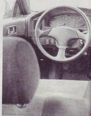
Kokpit: ličnost in športni dodatki