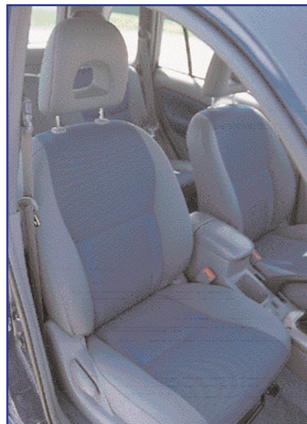
Barvne kombinacije dajejo že tako prostorni notranosti še zračnejši vtis.

Nekaj stikal je sicer še vedno nerodno nameščenih, kar je pogosta značilnost japonskih avtomobilov. Tudi zadaj je prostora dovolj, tako za potnike kot prtljago. Udobja je tudi zadaj dovolj, le treslajev je na zadnji klopi nekaj več kot spredaj, saj je zadnje vzmetenje dokaj trdo. To se pozna predvsem na makadamu, toda kdor se na take ceste večkrat poda, bo verjetno tako ali tako izbral različico s štirikolesnim pogonom. Na asfaltu ni težav, RAV4 se do-