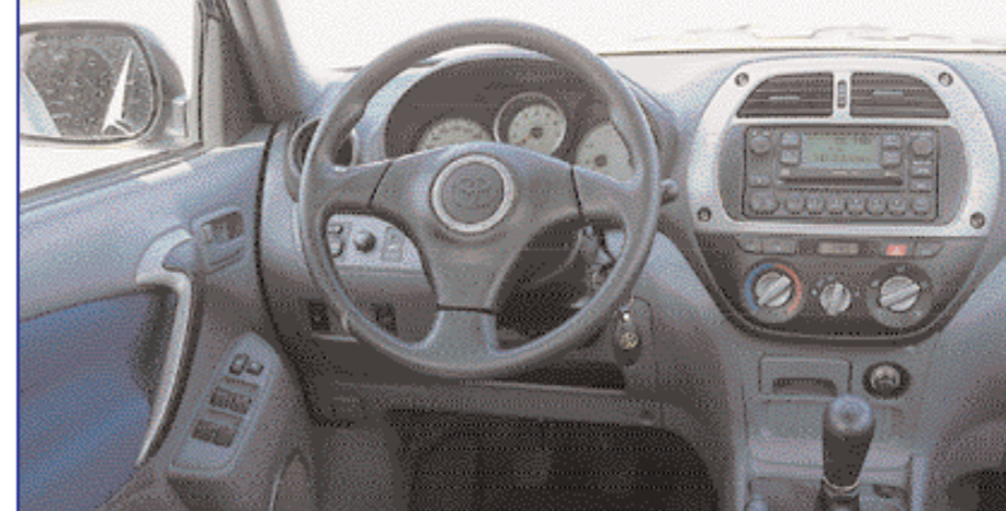
Voznikov delovni prostor je enak kot v štirikolesno gnanem RAV4, torej pregleden in na pogled simpatičen.

Ker testni RAV4 ni imel štirikolesnega pogona, se je lahko zadovoljil tudi z nekoliko šibkejšim motorjem kot štirikolesni gnan model. Tako ima motor za dva decilitra manjšo delovno prostornino, toda še vedno je povsem dovolj zmogljiv. Zmore 125 konjev, torej 25 manj kot dvolitrski model, vendar je zaradi manjše mase in manjšega trenja pri prenosu moči do koles dejansko enako hiter kot štirikolesni brat. Štirivaljni s prostornino 1794 kubikov se lahko pohvali s sistemom VVTi, logičnim nadaljevanjem sistema VVTi z dvolitrskega motorja. Tudi tu gre za prilagodljivo krmiljenje časa odpiranja sesalnih ventilov, toda tokrat ne stopenjsko, ampak zvezno. Posledica je večja prožnost motorja, tako