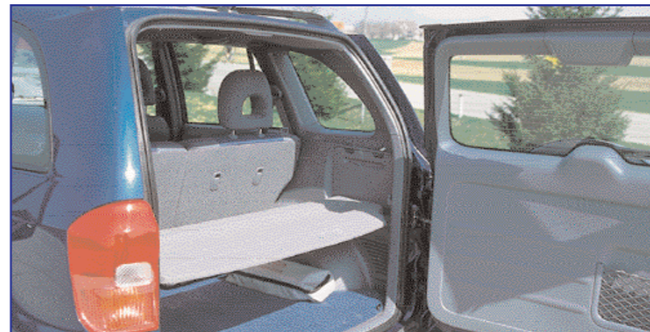
Prtljažnik ne sodi med prostornejše, prtljago petih potnikov za daljšo pot boste morali vanj zložiti zelo natančno (in skromno).