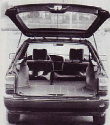
Prtljajnik: odlično obdelan, ogromno prostora