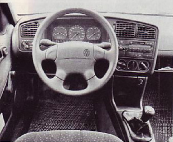
Sicer nekoliko v letih, ampak še vedno zgledna armaturna plošča

Lansko jesen je bil Volkswagnov passat deležen nekaj drobnih sprememb. Sedaj hoče biti še bolj imeniten (kot največji volkswagen, na primer VR6 exclusive) in še bolj dokazovati svoje že potrjene kakovosti.