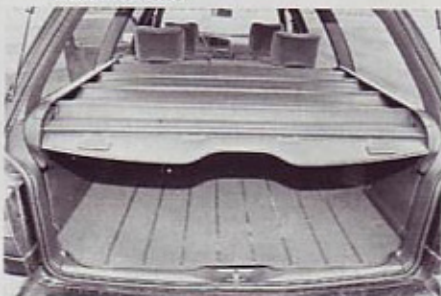
Praktična in pripravna roleta