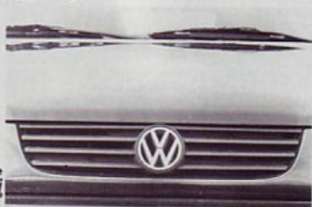
Zrak za hlajenje priteka odslej skozi "klasične" hladilne reže