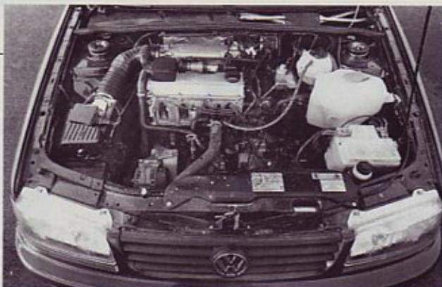
Motor: zanesljiv in kultiviran

Ta passat je po svoji zasnovi namenjen vsem tistim, ki s seboj prevažajo več prtljage, kot je normalno. Prtljažni prostor ob dvignjeni zadnji klopi meri v dolžino 106 centimetrov, širok je 136 centimetrov, žal pa se malo preveč zoži med zadnjim kolesnim pa-