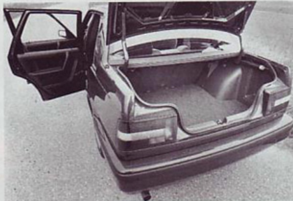
Čisto po volvovski: dovolj prostora in natančna izdelava

gobe. Izolacija kljub temu ni preveč učinkovita. Hladen dizel je ob zagonu pač robot in sklepeta. Ob ogretem motorju se sicer hrup umiri, je pa vseeno dobro slišen. Izrazito turbinsko živahen postane med 2000 in 3500 vrtljaji, visokih vrtljajev pa ne mara preveč. Moč 66 kW (90 KM) zadošča za zelo solidna potovalna povprečja, pa tudi če radi dirkate po mestu (sicer pa je to prepovedano); potem se vam glede na zmogljivosti tega motorja dizelskega porekla ni treba sramovati. Motor je izrazito dizelsko varčen, ob ostrem priganjanju poraba ne preseže 10 litrov na 100 kilometrov. Sodelovanje motorja z menjalnikom je prav tako vzorno, prestavna ročica je natančna, z dokaj dolgimi gibi, ni pa dirkaško hitra, saj takšne tudi ne moremo pričakovati. Lega in vodljivost vozila sta dobri, izdatno pa pomagajo tudi zanesljive zavore. Karoserijsko avto deluje čvrsto, je varen, to pa je lastnost, ki jo vsak kupec volva pričakuje in tudi dobi.