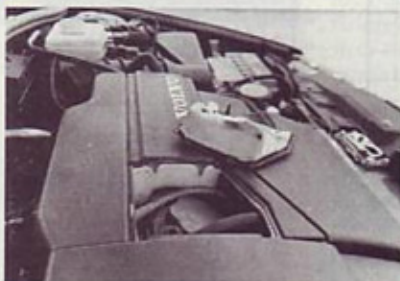
Motor se skriva pod izdatno zvočno izolacijo

Ta, že slabo desetletje najmanjši avto ugledne skandinavske tovarne, ki sicer ne nastaja med severnimi jeleni, ampak na Nizozemskem, je zadnje leto moč kupiti tudi s sodobnim 1,9-litrskim turbodizlom v nosu in z nekoliko spremenjeno zunanjo.