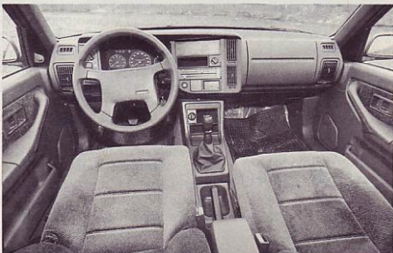
Kokpit: ličnost in urejenost

volvo lično obdelan, skoraj steren kokpit. Tu je sicer na voljo le najnujnejše, vendar nekatere stvari ugajajo. Na primer, ličen, po višini nastavljen servoojačan volanski obroč, ki je prijeten za oprijem, pa čeprav ima vrhni dve prečki previsoko nameščeni; pa vsestransko nastavljen voznikov sedež in tudi drugi sedeži, ki dajejo dovolj udobja za daljša potovanja. Prednji stekli v vratih krmili električno, prav tako tudi desno zunanje ogledalo, serijsko pa je volvo 460 GLE opremljen tudi še z zatemnjenimi stekli, osrednjo ključavnico in s pred-