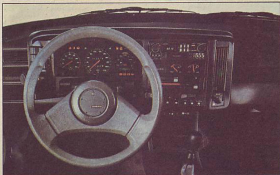
Zanimive rešitve – armaturna deska novega volva: desno ob merilniku hitrosti je poseben informacijski center za nadzorovanje delovanja pomembnejših funkcij avtomobila

Vseeno pa je bil prav »skok naprej« v javnost dober primer ustreznega ogrevanja bodočih kupcev za novi model. O njem bo torej že zdaj znana kar veliko, ko pa bodo pričeli s tekočih trakov v Volvovi nizozemski tovarni (v južnem delu države v mestecu Born) prihajati prvi avtomobili volvo 480 ES, bo seveda treba novi avto predstaviti še podrobneje.