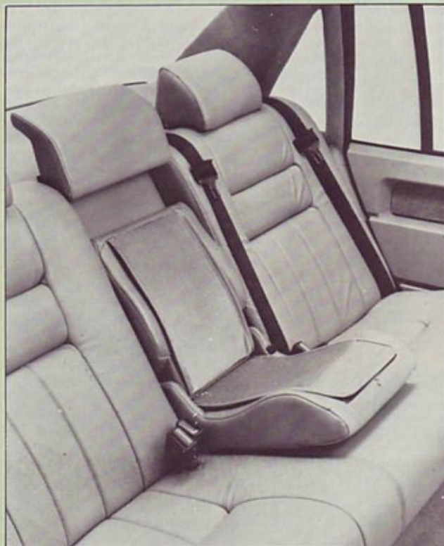
Zadaj tudi varen sedež za malčka.

trično podgreto sondo lambda, temveč tudi s kontrolno lučko, ki opozori na vsako tako napako v sistemu za dovod goriva ali vžiga, zaradi katere bi avto lahko oddajal v okolje velike količine ogljikovega monoksida, ogljikovodikov ali dušikovih oksidov. Skratka, pravi cestni servis v malem, saj ima celo samodiagnostični sistem s spominom in kontrolo izhlapevanja ogljikovodikov.