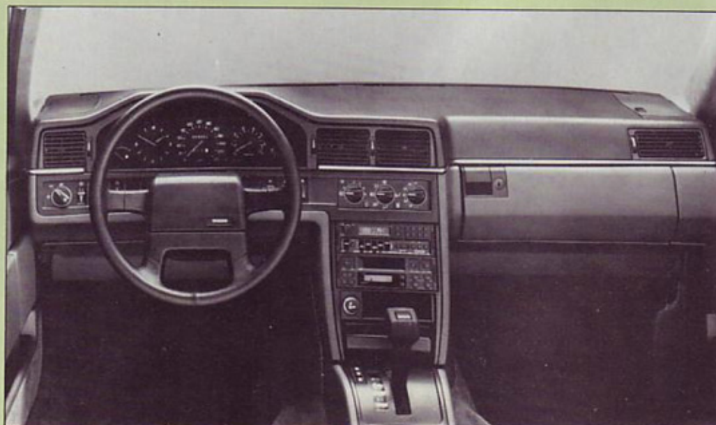
Pregledna in zares popolna armaturna plošča; vsa stikala so na dosegu roke.

Čeprav ima Volvo traktorje še vedno v svojem proizvodnem programu, se je zdaj končno otreseel vzdevka »traktor«, kot so Švedi ljubkovalno pravili svojim masivnim limuzinam. Pravzaprav je že serija 700 doživela takšne konstrukcijske spremembe, da je lahko voznik kljub še vedno robustni karoseriji užival v maksimalnem stiku z avtomobilom in v lahkotnosti vožnje.