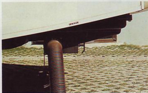
Odpadno vodo in fekalije spustite v kanalizacijo skozi gibljivo cev, ki jo pritrdite na skupni izpust.

nasprotni strani in ga je mogoče uporabljati, kot je običajno pri vseh bivalnikih, na plin ali elektriko (12 in 220 voltov).